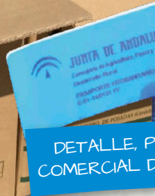
DETALLE, P COMERCIAL D