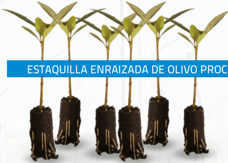
ESTAQUILLA ENRAIZADA DE OLIVO PROCEDENTE DE NUESTRO CMVB

Para viveros interesados en material certificado de alta selección, producimos estaquillas enraizadas y certificadas originarias de todas las variedades que tenemos en nuestro Campo de Material Vegetal Base (CMVB).