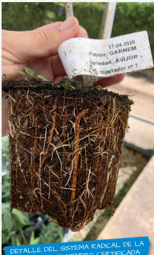
DETALLE DEL SISTEMA RADICAL DE LA PLANTA DE ALMENDRO CERTIFICADA