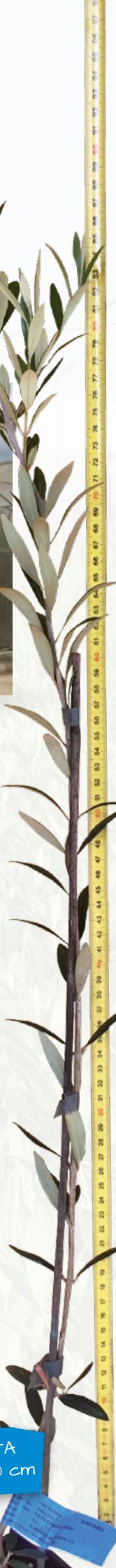
DETALLE, PLANTA COMERCIAL DE 100 cm

También ponemos a disposición de nuestros clientes, plantas resistentes a Verticilosis , utilizando un patrón resistente: VERTIRES® , el cual el cliente puede injertar de la variedad que desee.