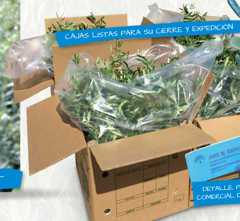
CAJAS LISTAS PARA SU CIERRE Y EXPEDICIÓN