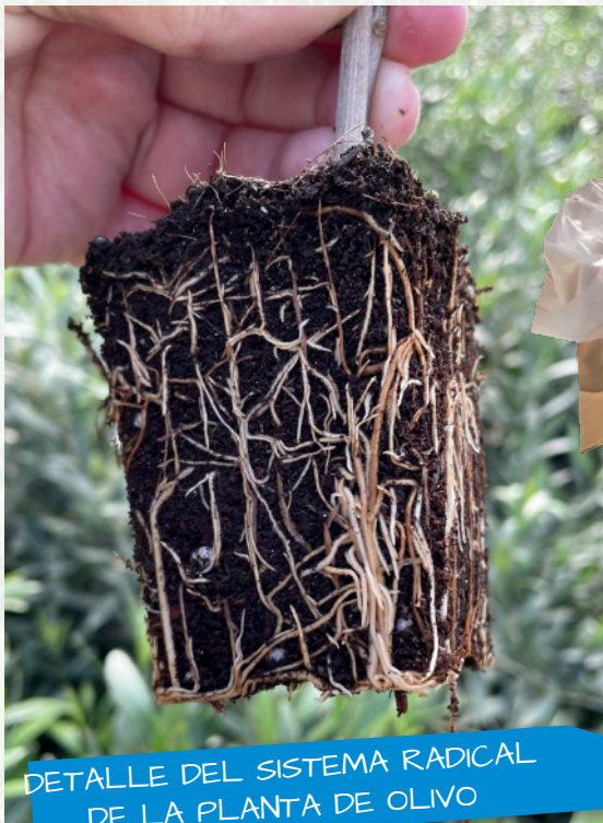
DETALLE DEL SISTEMA RADICAL DE LA PLANTA DE OLIVO

Ofrecemos plantas de seis a ocho meses de crecimiento en sustrato y en macetas de 7x7x8 cm de las siguientes variedades: Arbequina, Arbosana, Sikitita®, Sikitita Dos®, Martina®, Hojiblanca, Manzanilla de Sevilla, Manzanilla Cacereña y Koroneiki para cultivo en seto, con tallos a partir 40 y 50 cm , que cumplen todas las garantías sanitarias según Protocolo de Planta Certificada.