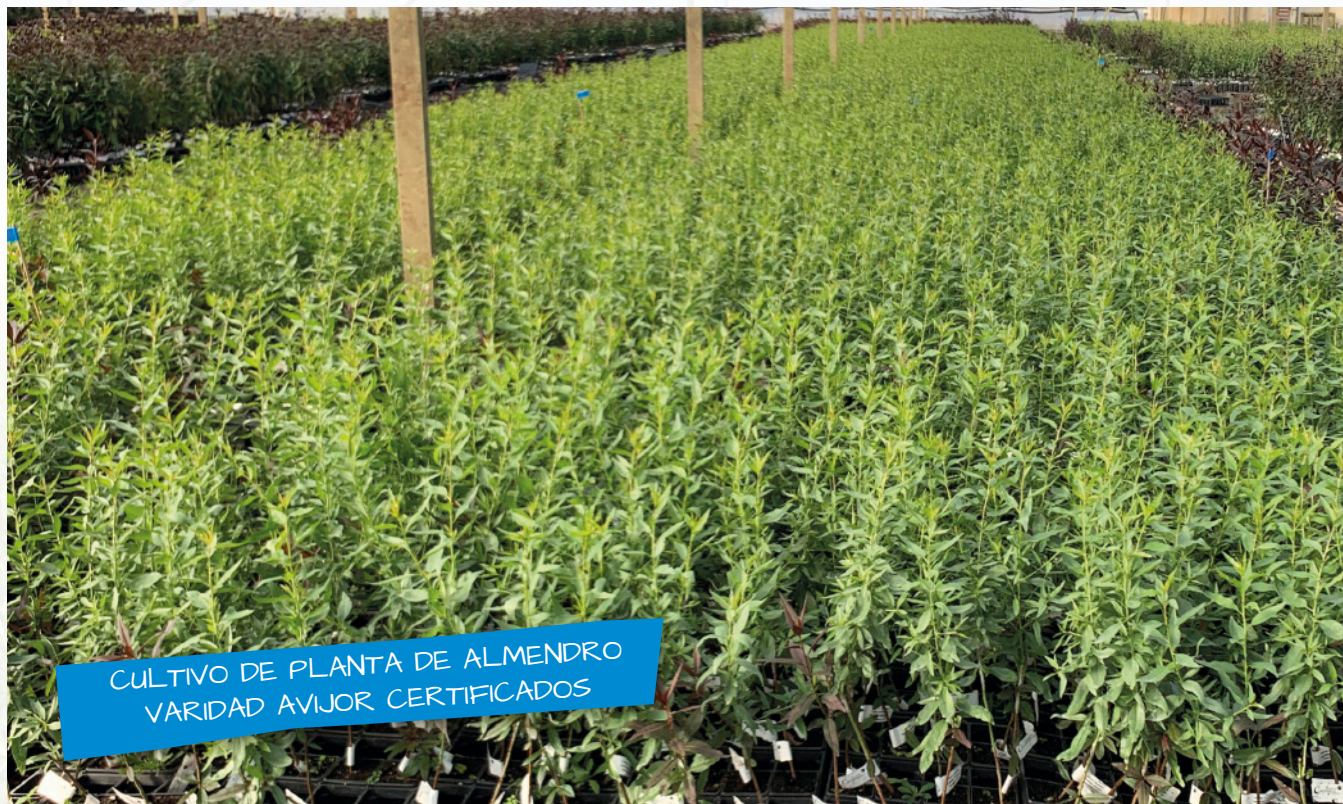
CULTIVO DE PLANTA DE ALMENDRO VARIEDAD AVIJOR CERTIFICADOS