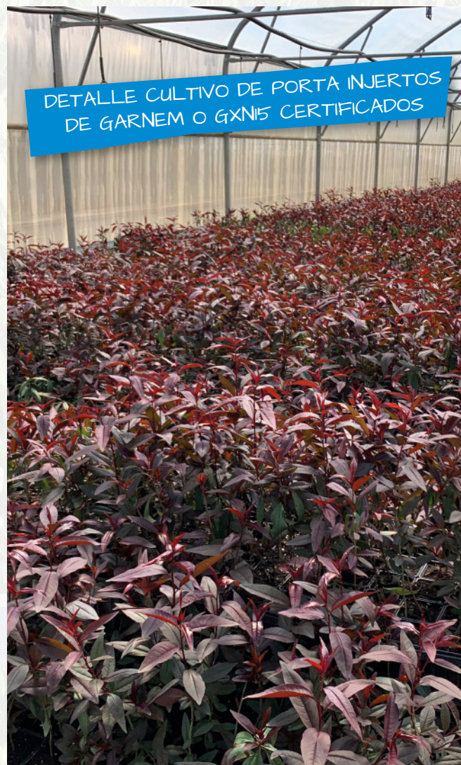
DETALLE CULTIVO DE PORTA INJERTOS DE GARNEM O GXN15 CERTIFICADOS